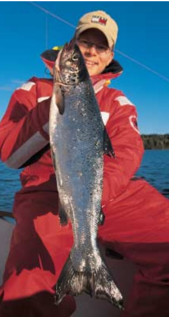
Auf Ansage: Markus hebt einen Barren Silber - einen von insgesamt vier abgeschleppten Lachsen des Tages.

Nachdem alle zehn Ruten bestückt sind und die Köder in Abständen bis knapp 100 Meter fächerförmig hinter dem Boot laufen, taut der wortkarge Kurt langsam auf und erzählt über die Binnenlachs-Angelei: „Obwohl der Västra und der Östra Silen bis zu 60 Meter tief sind, fange ich die meisten Lachse sehr flach - manchmal direkt unter der Wasseroberfläche. Jetzt im Herbst sind die Chancen frühmorgens oder spätnachmittags am besten.“ „Und wie sieht’s mit den Köderfarben aus?“, fragt Markus. „Ich habe mit natürlichen und gedeckten Farben am besten gefangen. Blau zum Beispiel geht eigentlich immer“, klärt uns Kurt auf. „Und wie schnell schleppst Du die Köder hinter dem Boot her?“, hakt